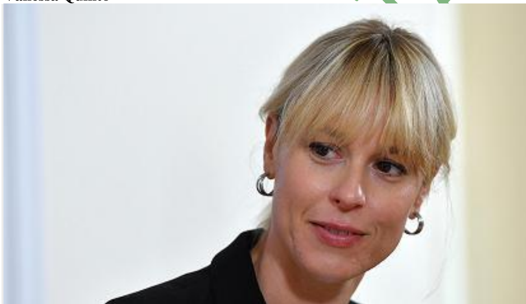
Federica Pellegrini

NutrInform Battery , l'etichetta dei prodotti alimentari per mangiare con consapevolezza diventa anche un'app.