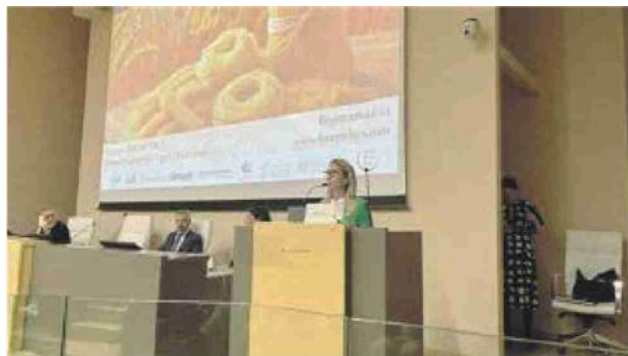
La riunione dei maggiori esperti, produttori e studiosi ospitata alla Camera di Commercio di Foggia