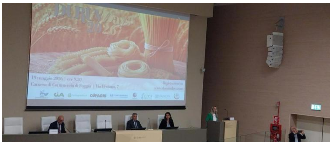
Grano duro, nel 2026 produzione nazionale con più 5%. Surplus per mercato globale

Buone prospettive per la campagna 2025-2026 del grano duro : la produzione dovrebbe riportare i volumi nazionali intorno alle 3,8 milioni di tonnellate, con un aumento del 5% circa rispetto alle 3,6 milioni di tonnellate della scorsa annata. Le condizioni climatiche, nel complesso, hanno sostenuto lo sviluppo della coltura nei principali areali produttivi, mentre il superamento del deficit idrico che ha penalizzato negli ultimi due anni Puglia e Basilicata rappresenta un segnale rilevante anche in chiave strutturale.