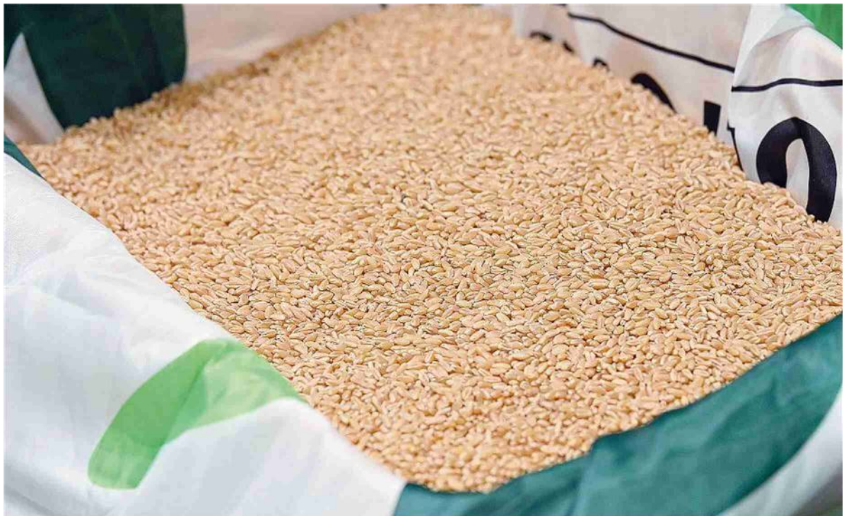
Un sacco di chicchi di grano: i produttori italiani sono in difficoltà

La politica ha provato a frenare la discesa dei prezzi ma con esiti disastrosi: il valore di mercato è precipitato da 305 a 257 euro a tonnellata