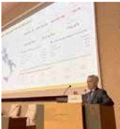
Buone notizie per produzioni italiane

La prospettiva di cali produttivi sia in Europa che in Nord America rende poco probabile un forte arretramento dei prezzi nella prossima campagna, anche se al tempo stesso, gli stock ancora elevati a livello globale continueranno a garantire un buon approvvigionamento al mercato, contribuendo a contenere eventuali pressioni rialziste. Su tutta la partita, ovviamente, incombe l'instabilità geopolitica, vero e proprio fattore determinante, per via degli effetti che può provocare sui flussi commerciali, sul cambio euro/dollaro, sui prezzi del petrolio e sulla situazione degli input produttivi.