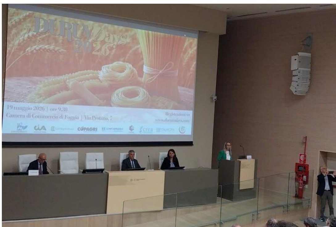
Grano duro, nel 2026 produzione nazionale con più 5%. Surplus per mercato globale

A Foggia attori filiera grano-pasta. Crea punta su editing genomico per cereali a paglia