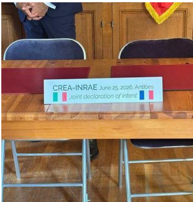
Crea e Inrae siglano alleanza su ricerca agroalimentare