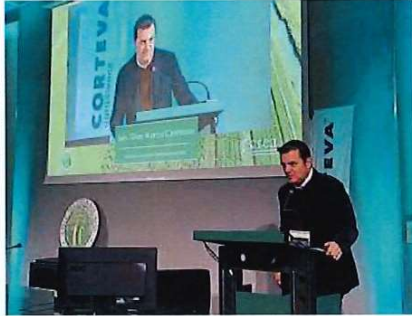
Il sottosegretario alle politiche agricole Gian Marco Centinaio

Durante l'incontro si è parlato inevitabilmente di clausola di salvaguardia e della nuova Pac, che impatterà si-