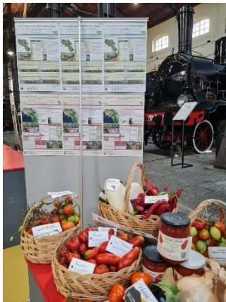
progetto ABC partecipazione all'evento "Eruzione del gusto" – Pietrarsa (NA)

Le attività di ricerca e sperimentazione sono rivolte alla preparazione e all'attuazione di progetti di rilevanza comunitaria, nazionale e regionale. Tali iniziative abbracciano tematiche riguardanti la biodiversità vegetale campana e laziale, la caratterizzazione varietale e tecnologica delle sementi mediante prove di campo e di laboratorio.