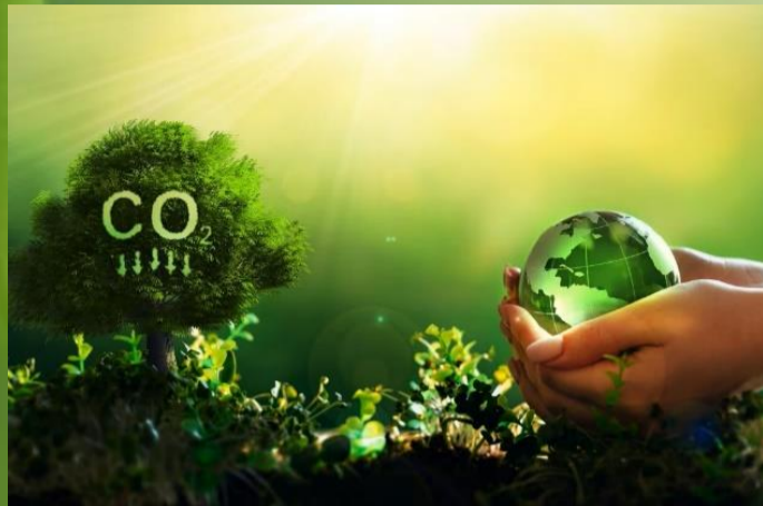
Sequestro del carbonio: mitigazione del cambiamento climatico e fertilità chimica del suolo