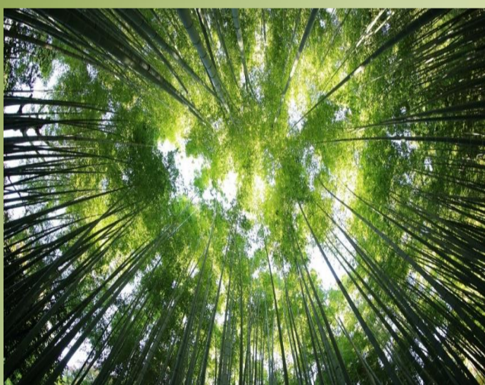
La pianta e l'atmosfera