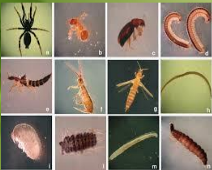
Suolo "vivo" e suolo "morto": alla scoperta della biodiversità degli artropodi nei suoli inerbiti