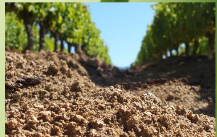
Conservazione del suolo: effetto delle piante sulla struttura del suolo e sull'erosione